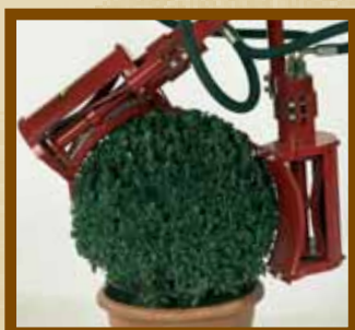
Kugelformen -Ø22 - Ø35 Bulbes -Ø22 - Ø35