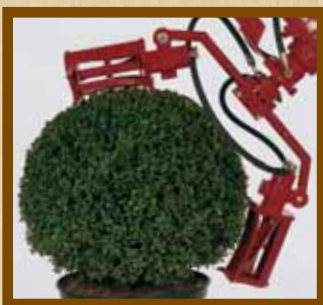
Kugelformen -Ø35 - Ø85 Bulbes -Ø35 - Ø85