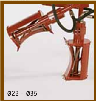
Ø22 - Ø35