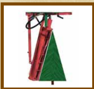
Kegelformen bis 90cm hoog Cone up to 90cm high

Gebr. Ezendam BV Oonksweg 35 7622 AW BORNE DIE NIEDERLÄNDE Tel. +31 (0)74 - 2670635 Fax +31 (0)74 - 2669197 E-mail: info@ezendam.info www.ezendam.info